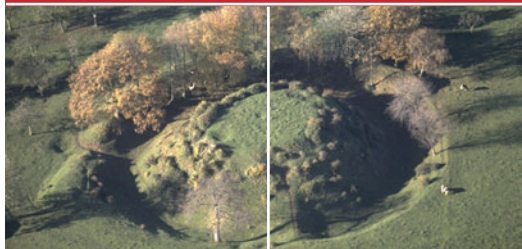
Motte de Fressenneville (Somme)