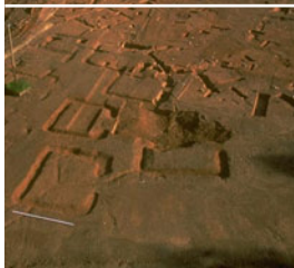
Bibracte, vue de la nécropole de la Croix du Rebut, Tène finale-époque augustéenne, 1998